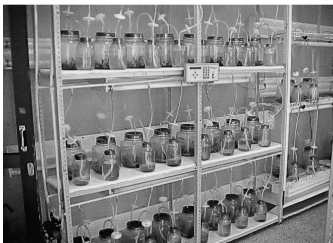
Figura 1. Sistema de biorreactores de inmersión temporal

propagación mixotrófica de Eucaliptus grandis Castro (2001, p. 34), utilizando como recipientes de cultivo frascos de cinco litros de capacidad para los explantes y de un litro de capacidad para el medio de cultivo. Los recipientes donde se colocaron los explantes y el medio de cultivo tenían un tapón de silicona con dos orificios en los cuales se insertaron tubos de vidrio lo que permitió interconectar simultáneamente ambos frascos con mangueras de silicona a un sistema de entrada y salida de aire esterilizado por filtros hidrófobos de 0,2 micras, provenientes de un compresor accionado por un programador automático, para el manejo adecuado de la frecuencia y duración de los ciclos de inmersión (figura 1).