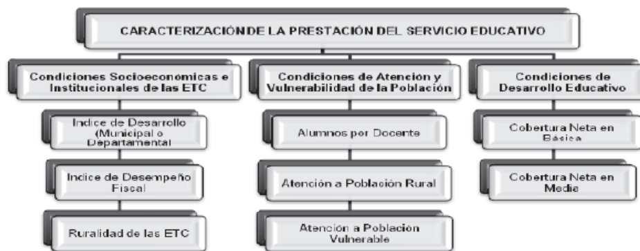
Figura 3. Dimensiones y variables de la prestación del servicio educativo Fuente: Tomado de Documento CONPES Social 137 de 2011, p. 10.

Según el MEN, con esta clasificación se busca asignar los recursos de acuerdo con criterios de equidad: se asigna un mayor valor a aquellas entidades territoriales que atienden una mayor población rural y vulnerable y que se encuentren en contextos de menor desarrollo económico; se asignan valores diferenciados de acuerdo al nivel de estudios, haciendo un especial énfasis en los que se necesita mayor cobertura, como