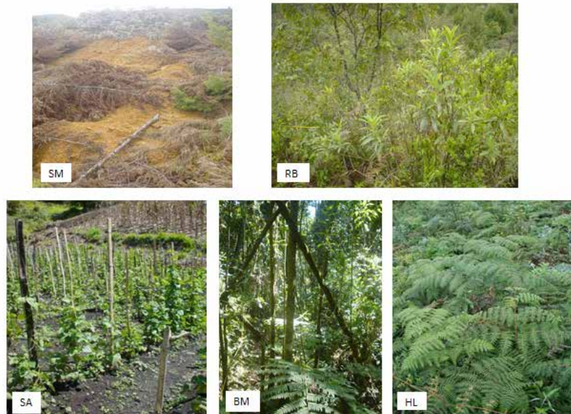
Figura 1. Coberturas vegetales evaluadas: Suelo minero (SM), Rastrojo bajo (RB), Suelo agrícola (SA), Bosque mixto (BM) y Helechal (HL).

Selección de sitios de muestreo: Se seleccionaron cinco sitios de muestreo, que presentan diferentes coberturas vegetales. Bosque mixto (BM), Rastrojo bajo (RB), Helechal (HL), Suelo agrícola (SA) y Suelo minero (SM). Estas coberturas permitieron conocer en parte la dinámica de los HMA en los diferentes suelos (Figura 1).