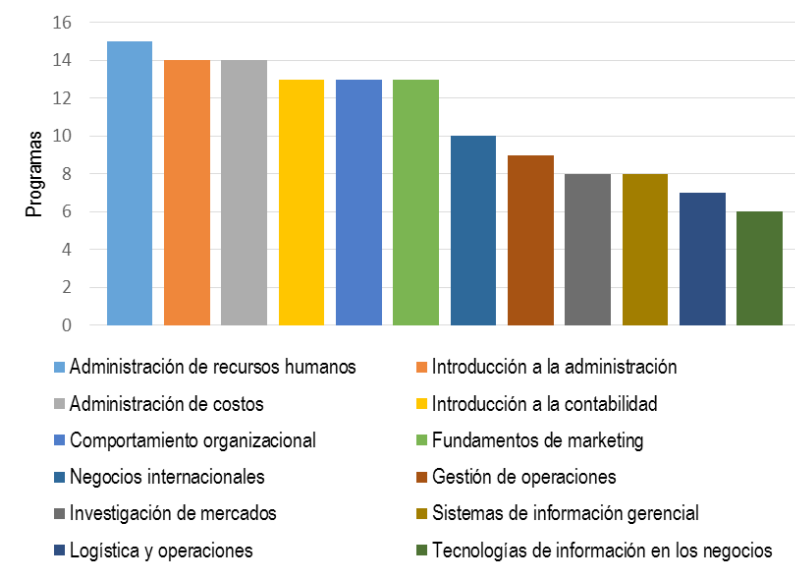
Figura 2. Cursos comunes ofrecidos por los 16 programas de administración de empresas latinoamericanos analizados.